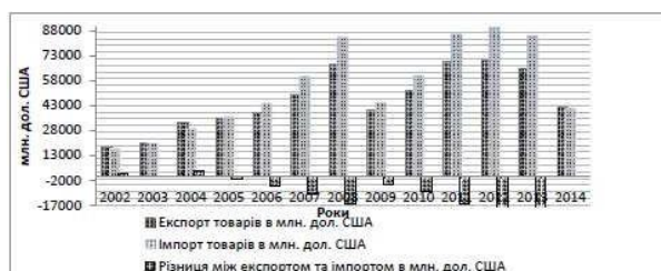
Малюнок 1 – Динаміка зовнішньої торгівлі в цілому по Україні за 2002-2014 рр.

Головні експортно-орієнтовані галузі залишаються надзвичайно енергоємними, що робить їх критично залежними від імпорتنних енергоносіїв та обмежує можливості нарощування експорту за рахунок девальвації національної валюти.