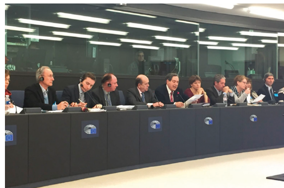
AEDE Congress in Strasbourg (January 11, 2018)