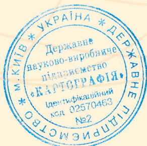
Віталій ОСТРОУХ Головний редактор ДНВП «Картографія»